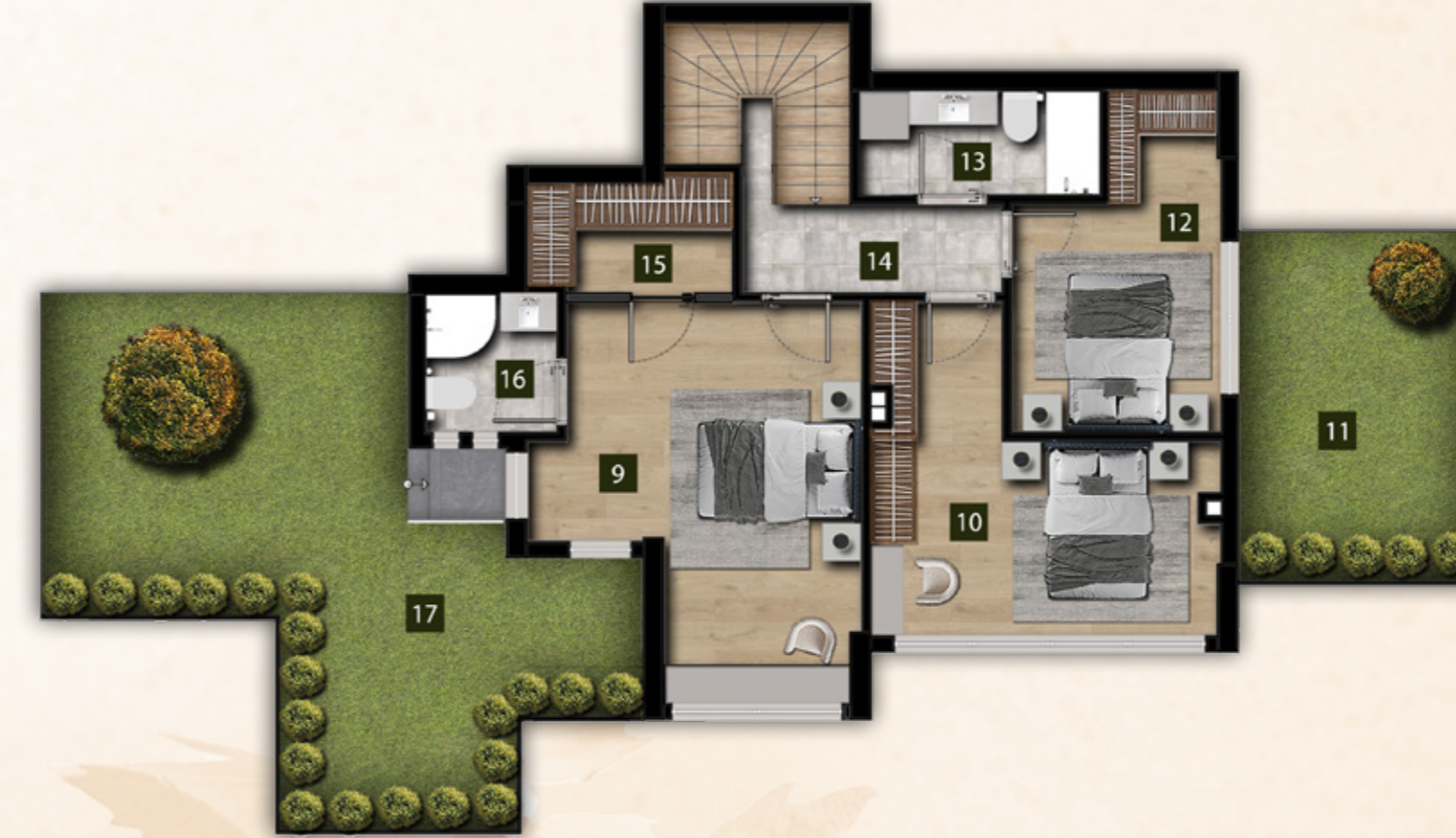
1. KAT PLANI