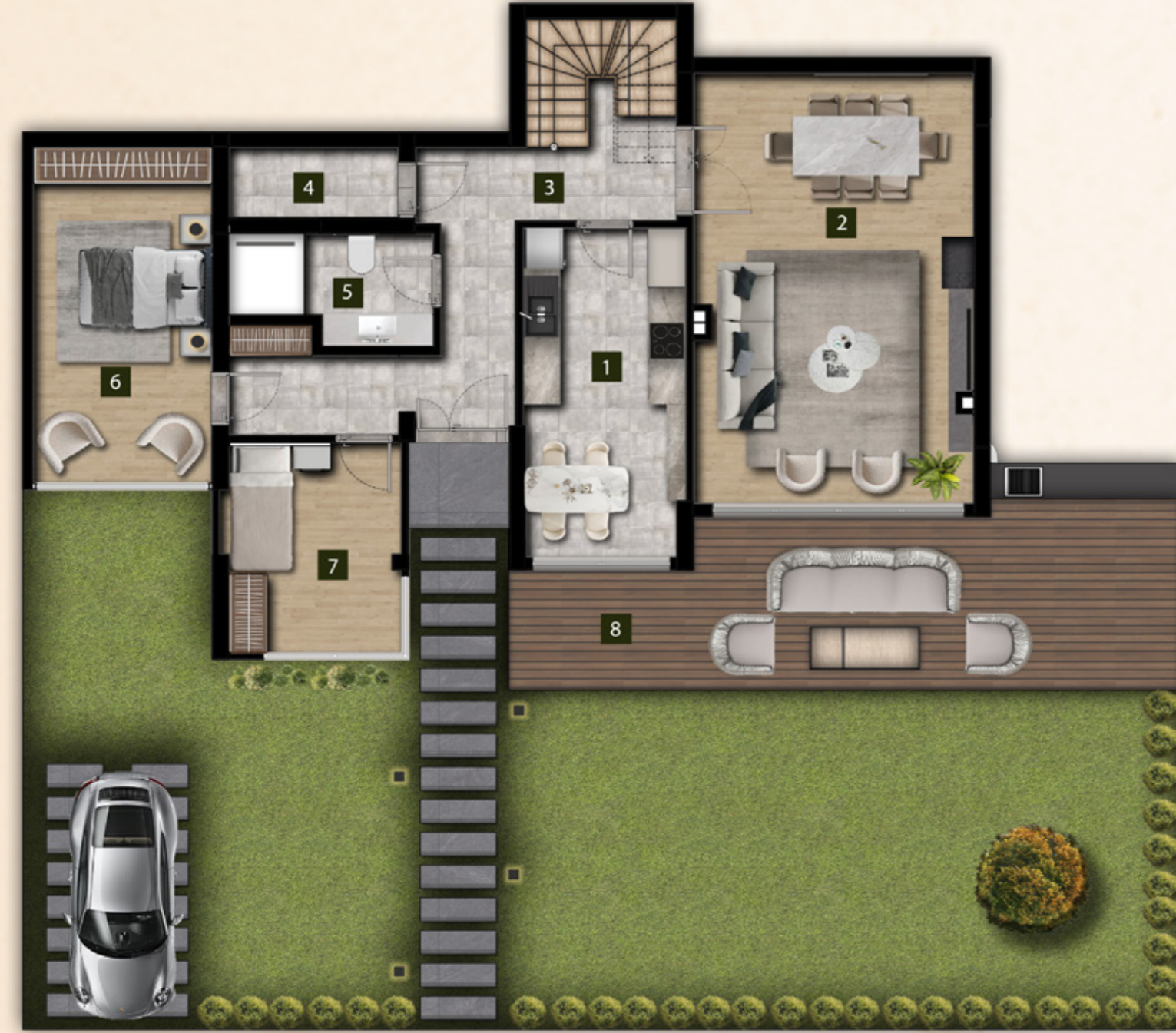
ZEMİN KAT PLANI